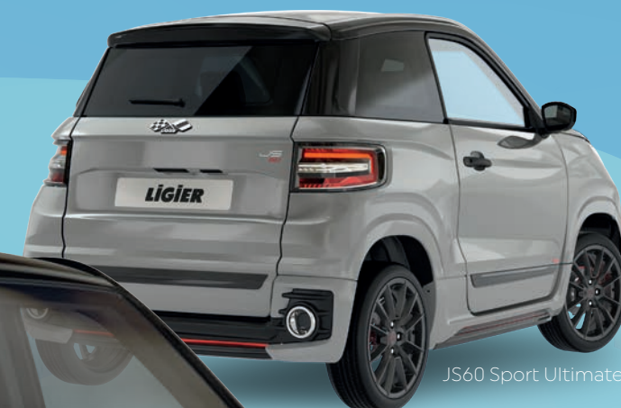
JS60 Sport Ultimate