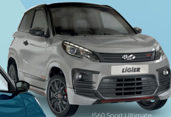
JS60 Sport Ultimate